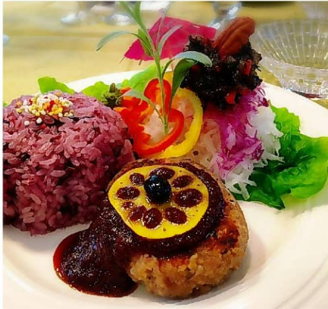
高野豆腐のハンバーグ/プルーンソース ひじきドレッシング大根サラダのプレート