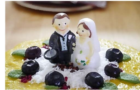
華やかで鮮やかなオリジナルケーキは、プレゼントに最適☆

これまでのマクロビオティックを覆すオシャレで、インパクトのあるカラフルなルックスと、輪郭のはっきりしたテイストのベジタリアン料理とスイーツ♪